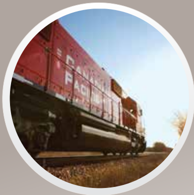
3 SCHIENENVERKEHRSUNTERNEHMEN DER KLASSE I (CP, CN UND BNSF)

Richtung Osten nach Europa, in den Mittleren Osten und nach Asien