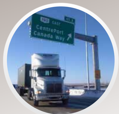
UN POINT DE TRANSBORDEMENT INTERNATIONAL